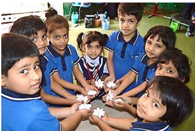
Schulfeier in der Rising Sun School in Hyderabad, Indien.

Der letzte Schultag vor den Weihnachtsferien, Do, 20.12., beginnt mit dem traditionellen ökumenischen Gottesdienst in der katholischen Stadtkirche um 8.00 Uhr. Eine herzliche Einladung an alle Schülerinnen und Schüler, Kolleginnen und Kollegen und interessierten Eltern. Der Unterricht endet an diesem Tag um 11.15 Uhr, im Anschluss fahren die Schulbusse in alle Richtungen. Ein gesonderter Plan für die Abfahrt der Busse wird rechtzeitig in der Schule ausgehängt.